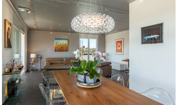
KZO00048 Freiheit und Lifestyle - 4.5 Zimmer Attikawohnung in Winterthur/Grüze - Essen