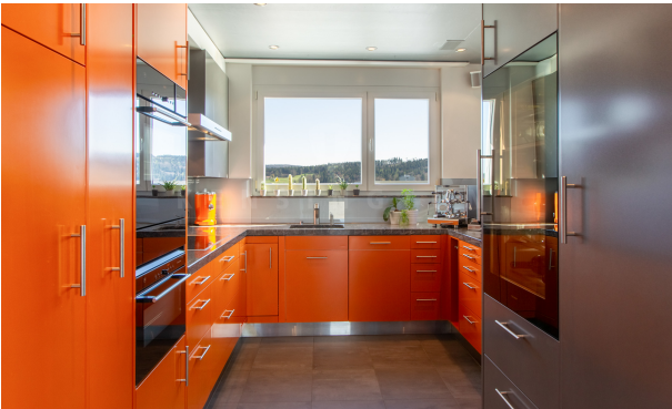
KZO00048 Freiheit und Lifestyle - 4.5 Zimmer Attikawohnung in Winterthur/Grüze - Küche