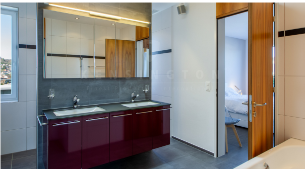
KZO00048 Freiheit und Lifestyle - 4.5 Zimmer Attikawohnung in Winterthur/Grüze - Bad/Dusche/WC en Suite mit Tageslicht