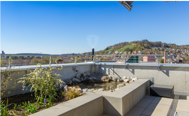
KZO00048 Freiheit und Lifestyle - 4.5 Zimmer Attikawohnung in Winterthur/Grüze - Biotop