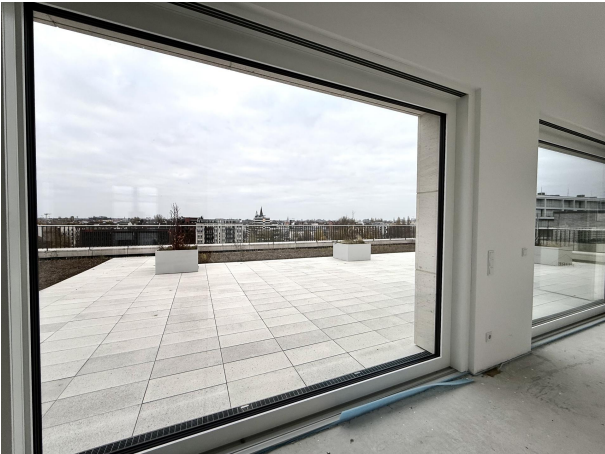
Luxus-Penthouse mit spektakulärer Hauptterrasse