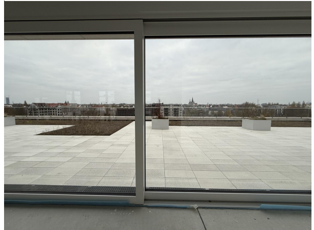
Einzigartige Terrasse zur freien Gartengestaltung