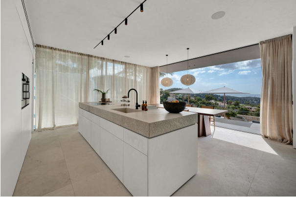
10. Kitchen in Costa den Blanes