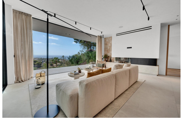
5. Living room in Costa den Blanes