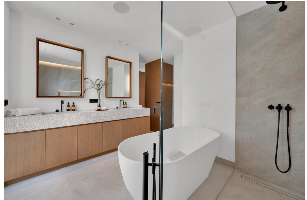
13. Bathroom in a master bedroom