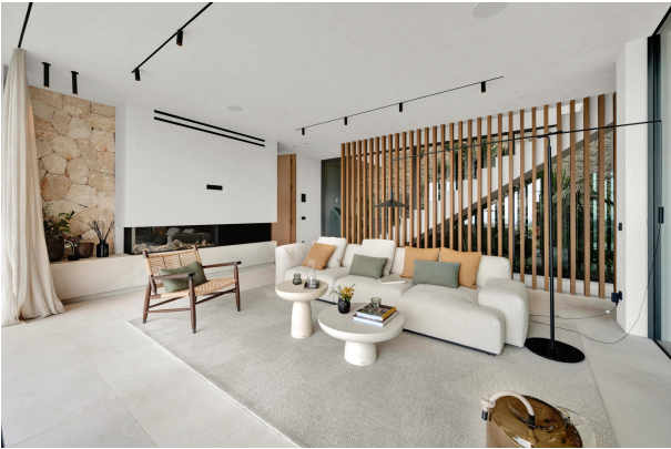
6. Living room