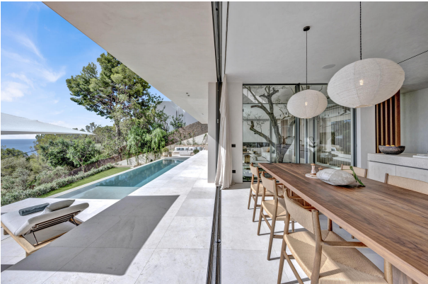
8. Dining room in Costa den blanes