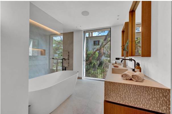
14. Bathroom in Costa den Blanes