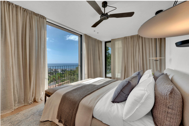
12. Master bedroom in a villa for sale