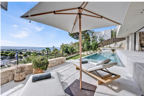
2. Sea view villa for sale