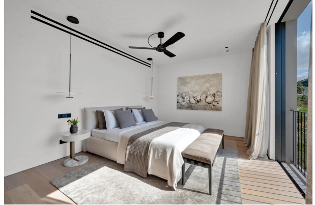
11. Master bedroom