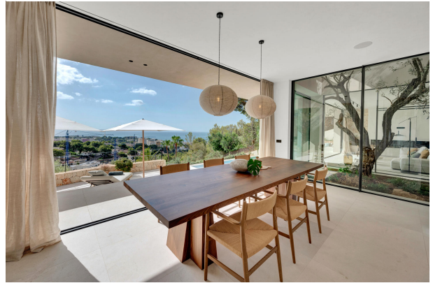
7. Dining area