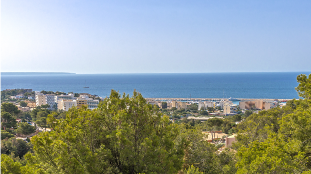
4. Views from a villa in Costa den Blanes