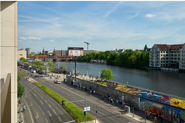
Das PURE Living an der Spree