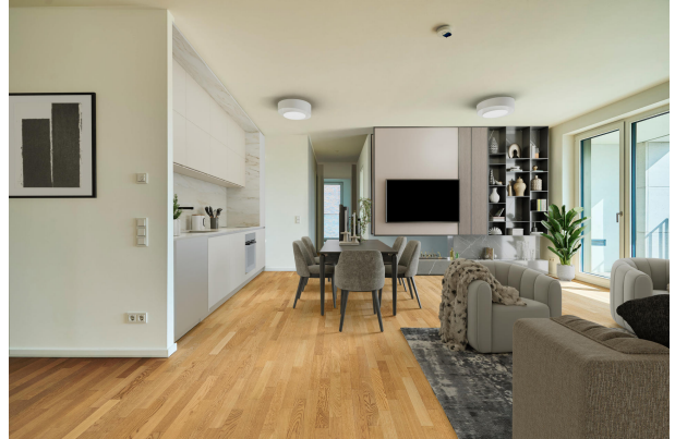
Wohn- Essbereich mit Terrasse