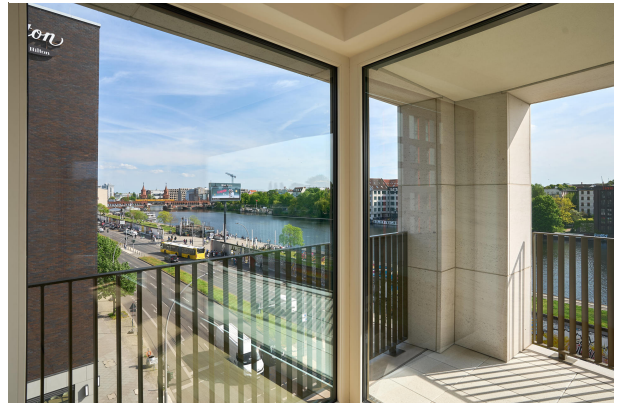
Wohnbereich mit Zugang zur ersten Terrasse