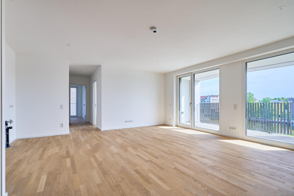
Spektakulärer Blick mit Zugang zu einer der beiden Terrassen