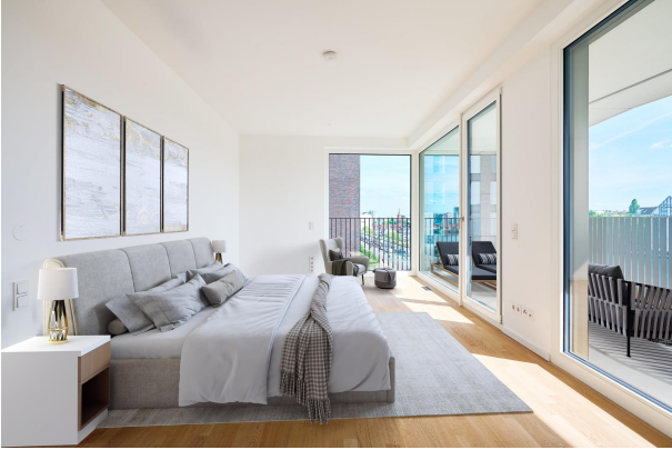
Hauptschlafzimmer mit Zugang zur zweiten Terrasse