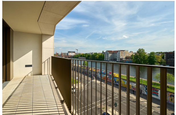
Blick auf die East Side Gallery