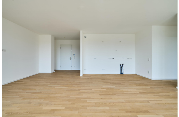
Wohnbereich mit Zugang zur ersten Terrasse