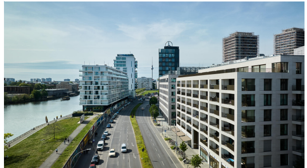
PURE Living an der Spree