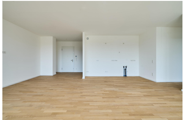
Wohnbereich mit Zugang zur ersten Terrasse