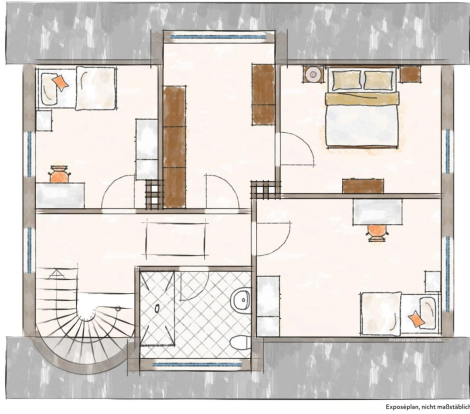
Exposplan, nicht maßstäblich