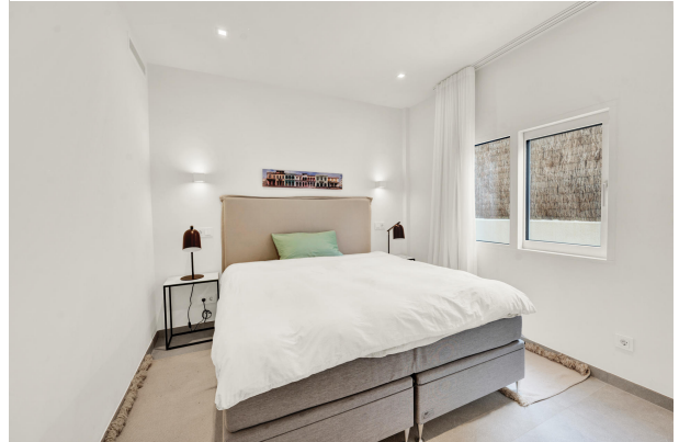
Bedroom in Portals