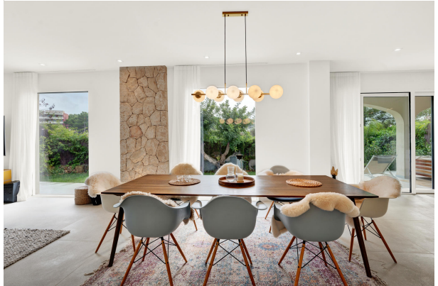
Dining room in Portals garden apartment