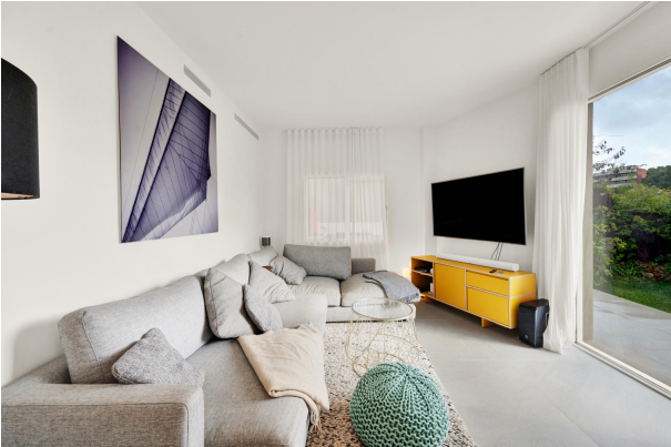
Living room in apartment for sale in Portals