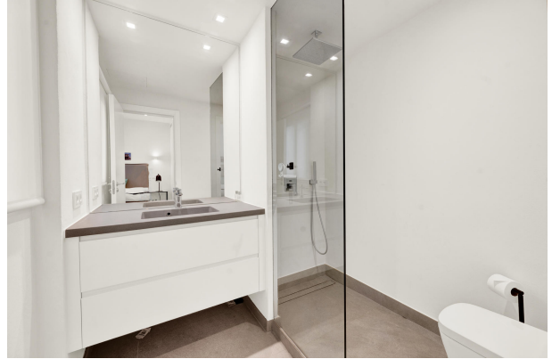
Bathroom in a modern garden apartment for sale