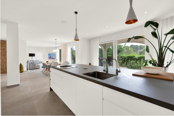
Modern kitchen in Portals