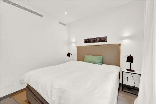
Bedroom in garden apartment for sale