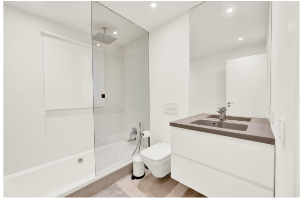
Bathroom in a ground floor apartment for sale