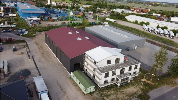
Halle Ansicht Hinten & Seite