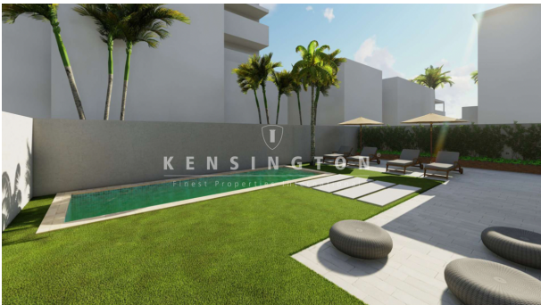
Captura de pantalla 2023-12-04 a las 22.53.45