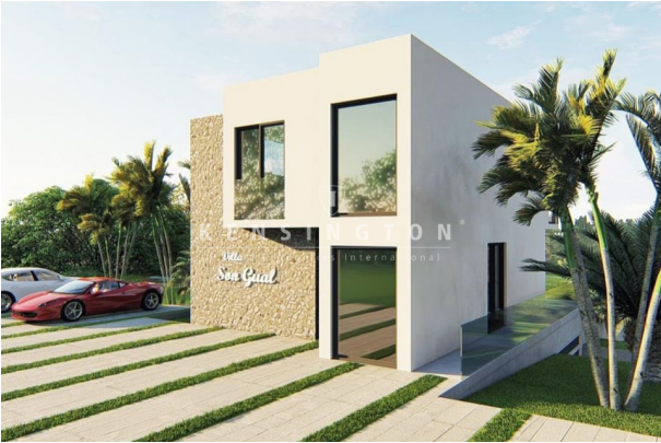
Plot & façades