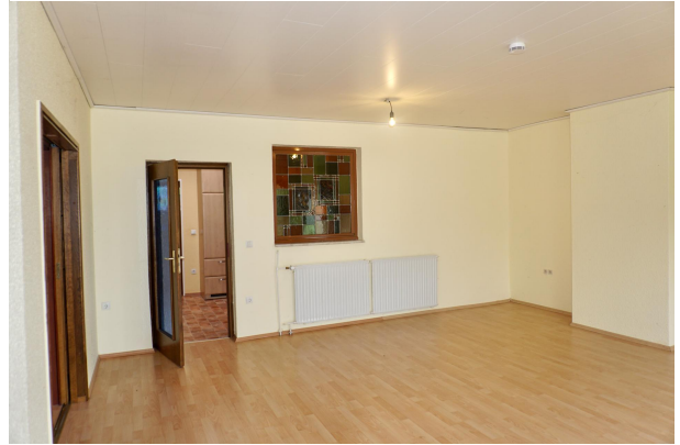
Esszimmer mit Kamin