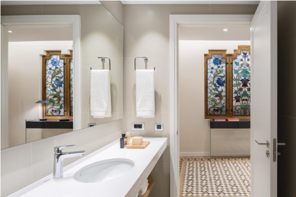
Captura de pantalla 2024-06-20 112948