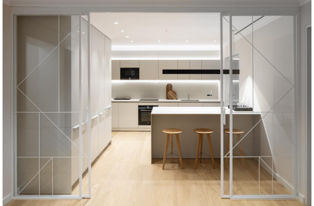
Captura de pantalla 2024-06-20 113326