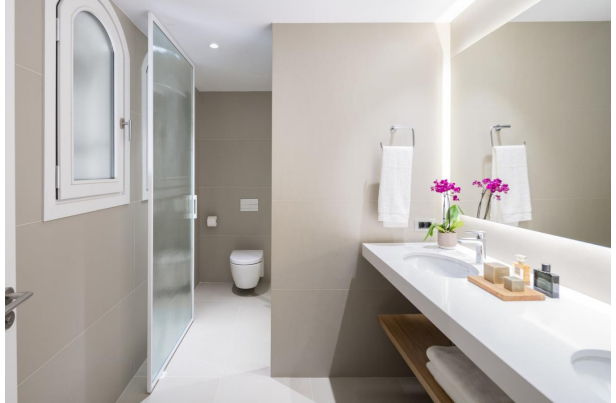
Captura de pantalla 2024-06-20 112838