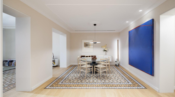
Captura de pantalla 2024-06-20 112736