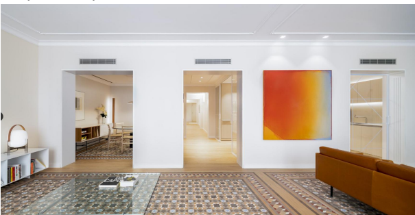
Captura de pantalla 2024-06-20 113026