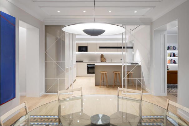
Captura de pantalla 2024-06-20 113250