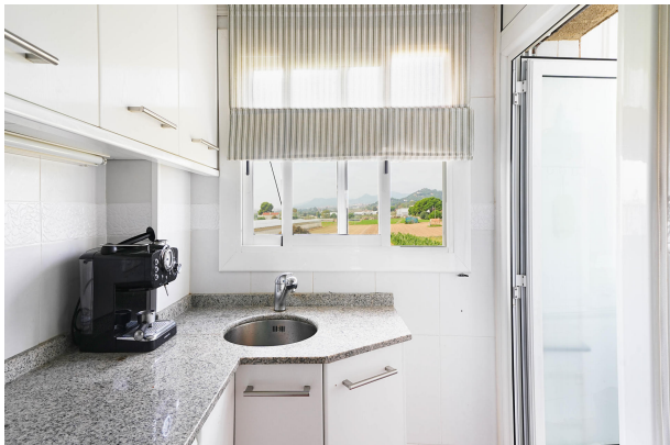
pis llavaneres 07.10.24 (6 de 21)