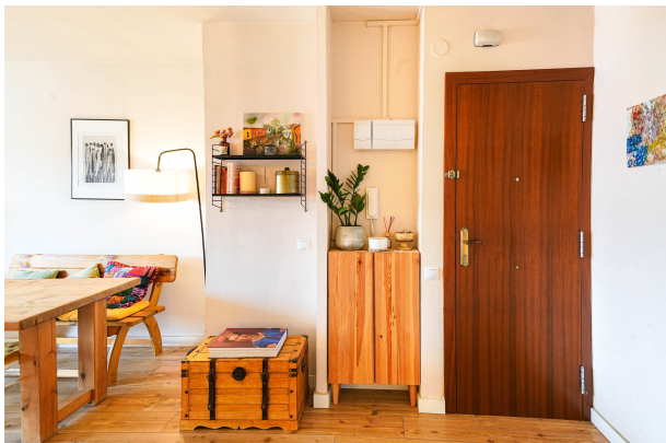
pis llavaneres 07.10.24 (9 de 21)