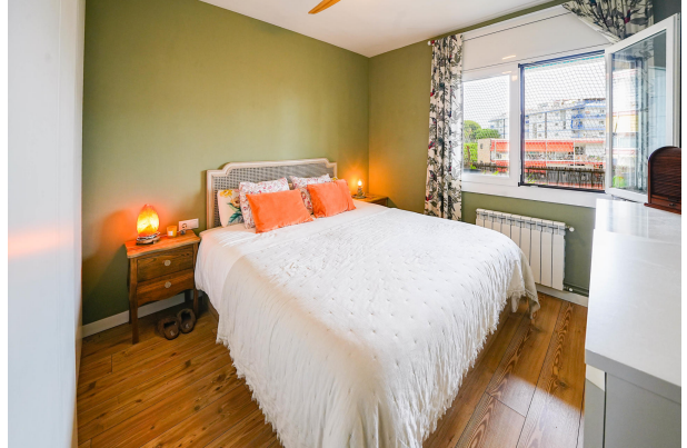
pis llavaneres 07.10.24 (3 de 21)