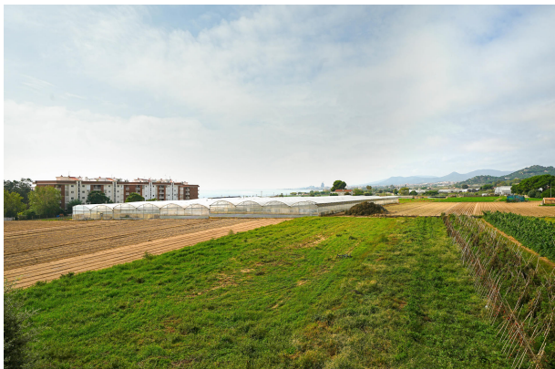
pis llavaneres 07.10.24 (18 de 21)