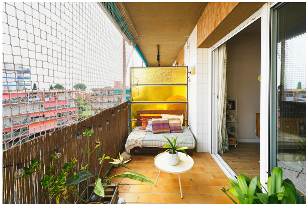
pis llavaneres 07.10.24 (10 de 21)