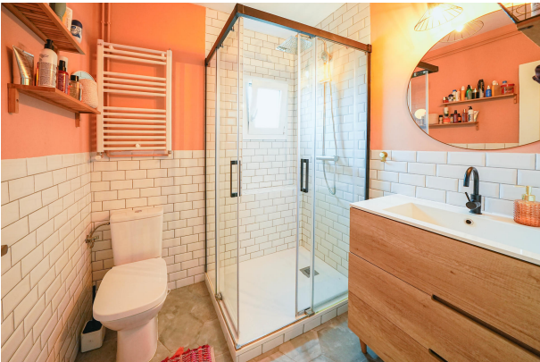
pis llavaneres 07.10.24 (4 de 21)