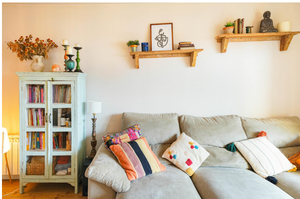
pis llavaneres 07.10.24 (13 de 21)