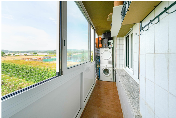
pis llavaneres 07.10.24 (15 de 21)