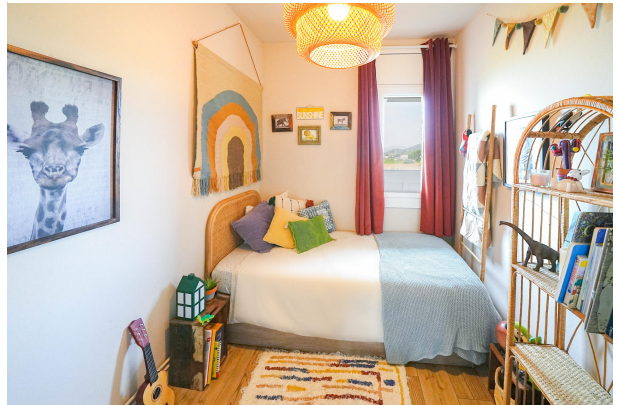
pis llavaneres 07.10.24 (5 de 21)