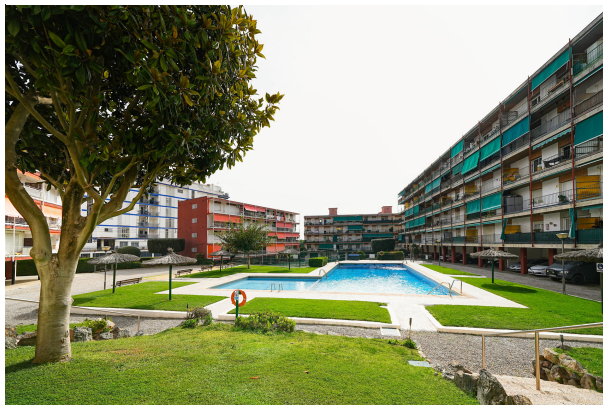
pis llavaneres 07.10.24 (19 de 21)