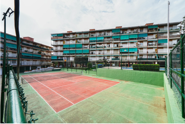
pis llavaneres 07.10.24 (16 de 21)