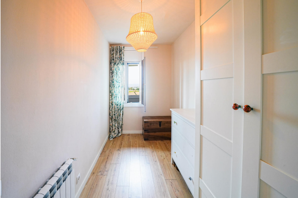
pis llavaneres 07.10.24 (1 de 21)