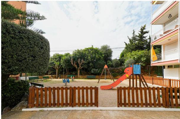
pis llavaneres 07.10.24 (20 de 21)