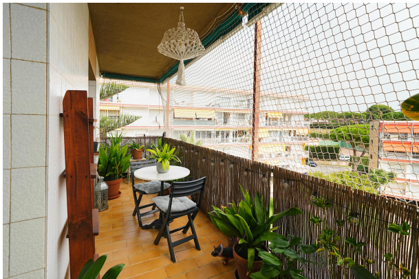
pis llavaneres 07.10.24 (1 de 1)