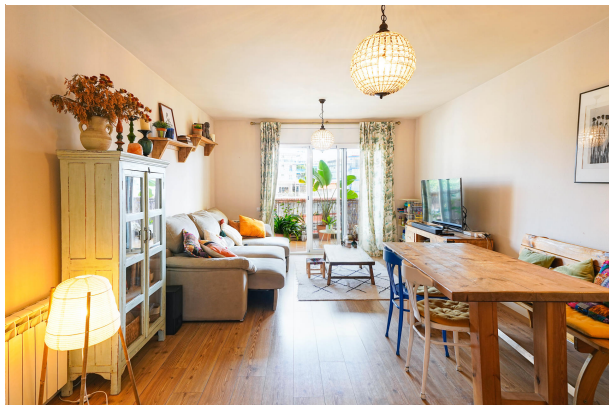
pis llavaneres 07.10.24 (12 de 21)