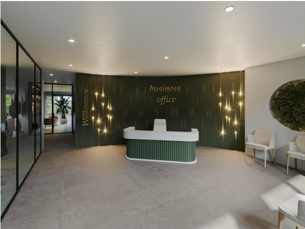
Renderingfoto 1 - Erdgeschoss