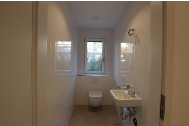
WC 1 EG