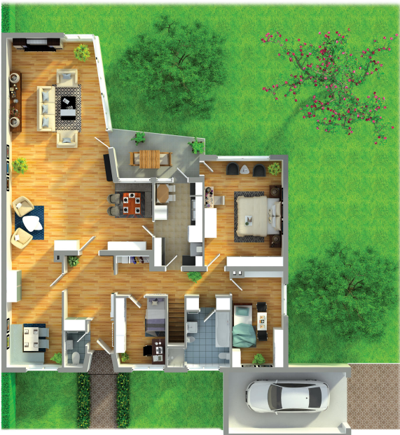
Grundriss 3 D