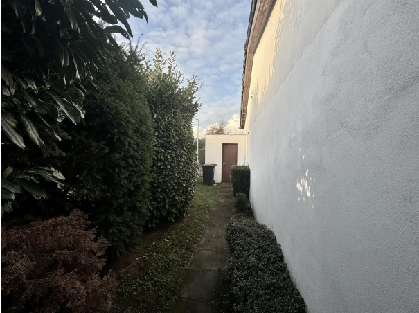
Garten Blick zur Garage