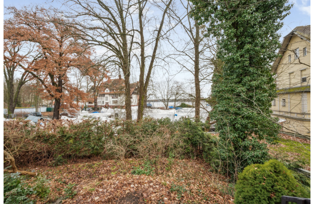
Blick auf den großen Wannensee aus dem Vorgarten