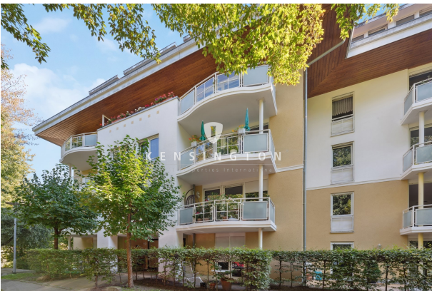
Haus von vorne