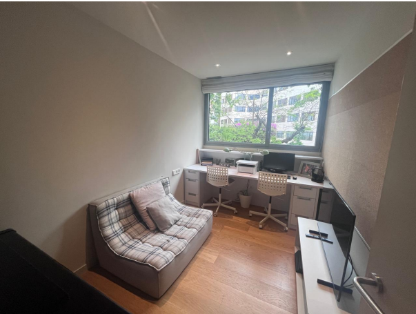
22. HABITACION 4