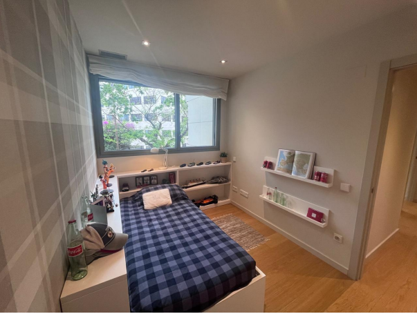
20. HABITACION 3