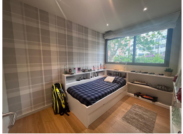
21. HABITACION 3