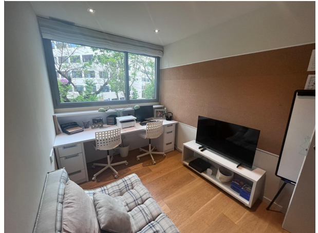
23. HABITACION 4