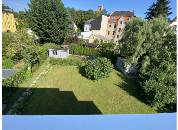
Blick in den Garten