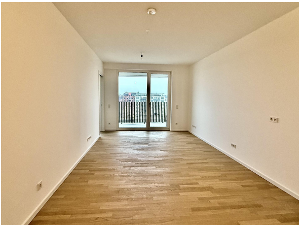
Wohnraum mit Blick auf die Spree