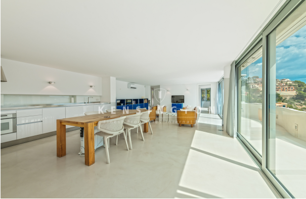
Wohnung in Pt Andratx Mallorca - esszimmer