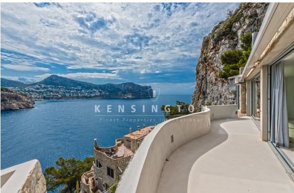
Wohnung in Pt Andratx Mallorca - meerblick