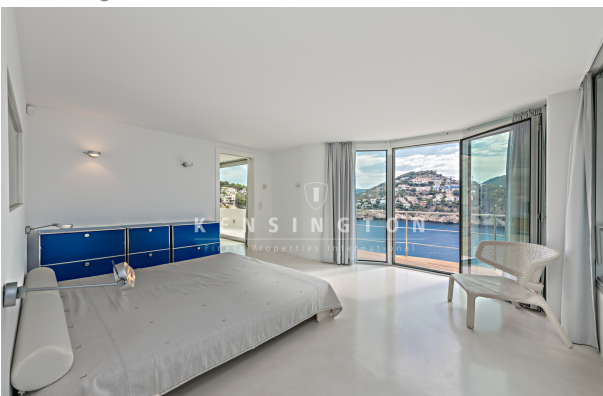
Wohnung in Pt Andratx Mallorca - schlafzimmer