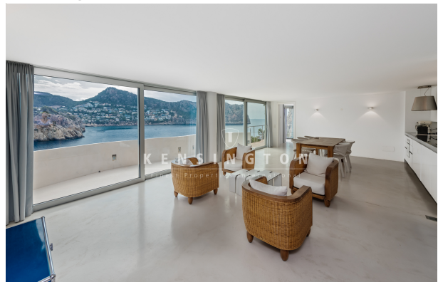
Wohnung in Pt Andratx Mallorca - wohnzimmer