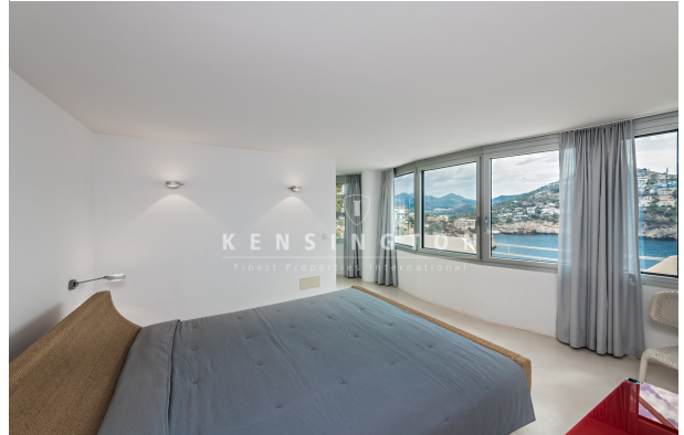
Wohnung in Pt Andratx Mallorca - schlafzimmer