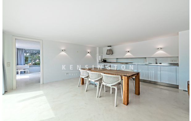
Wohnung in Pt Andratx Mallorca - küche