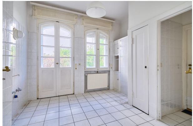
Küche mit Terrassenausgang