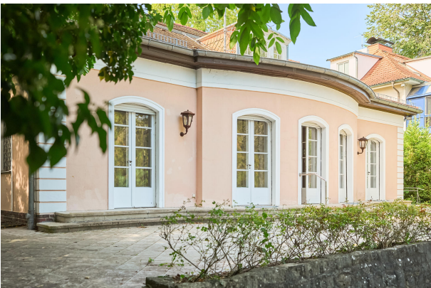
Garantierte, ruhige Abende