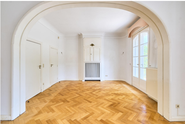
Wohnzimmer mit Kamin