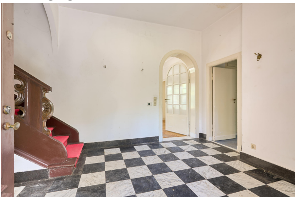
Hauseingang / Flur