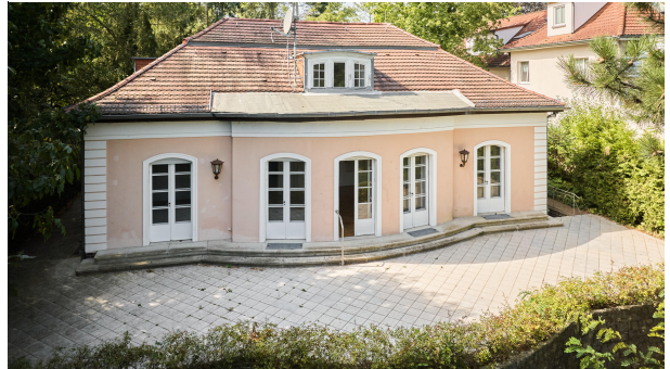
Große Terrasse zum Genießen