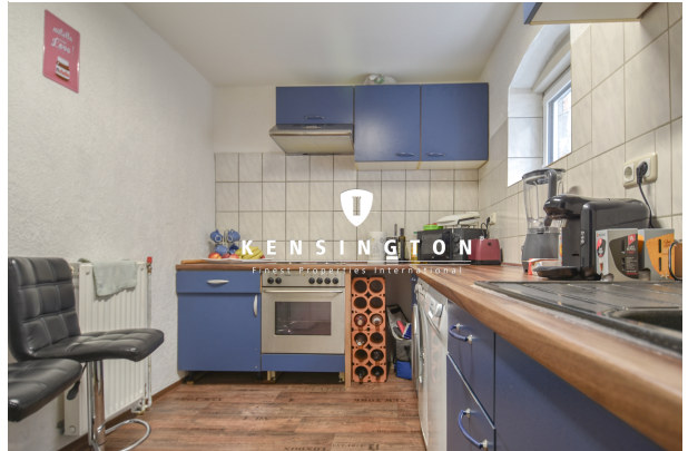
KSW313-Haus in Essingen-Küche EG