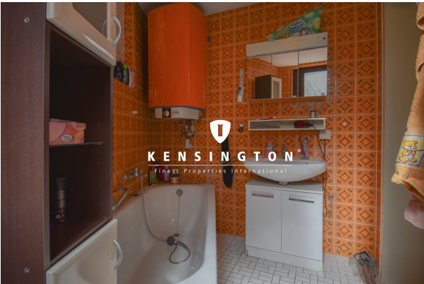
KSW313-Haus in Essingen-Bad EG