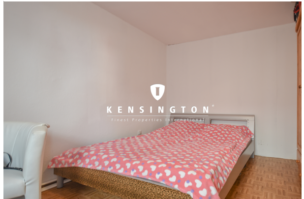
KSW313-Haus in Essingen-Schlafzimmer EG