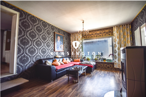
KSW313-Haus in Essingen-Wohnzimmer OG