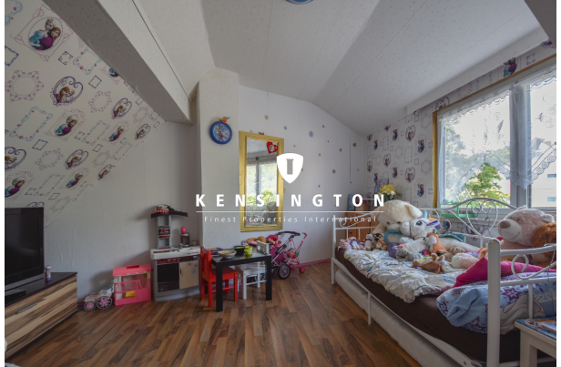
KSW313-Haus in Essingen-Kinderzimmer OG