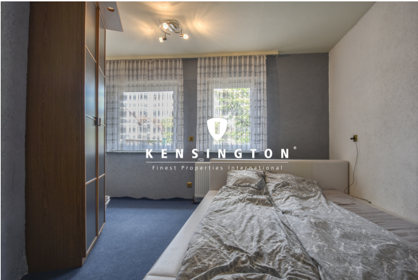
KSW313-Haus in Essingen-Schlafzimmer EG