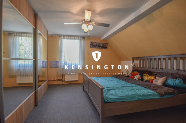
KSW313-Haus in Essingen-Schlafzimmer OG