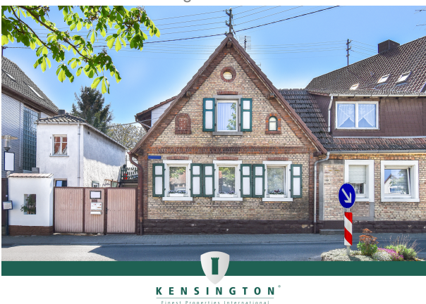
KSW313-Haus in Essingen