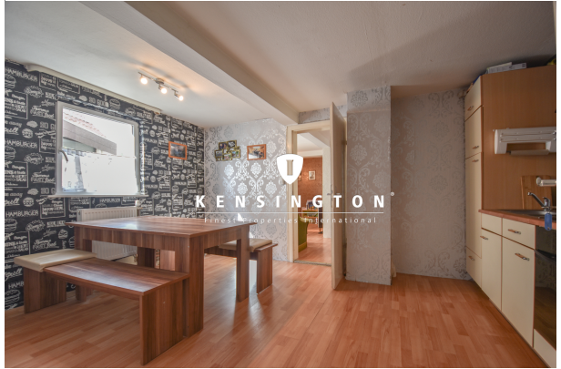
KSW313-Haus in Essingen-Küche OG