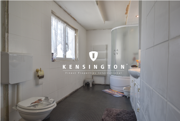
KSW313-Haus in Essingen-Bad OG