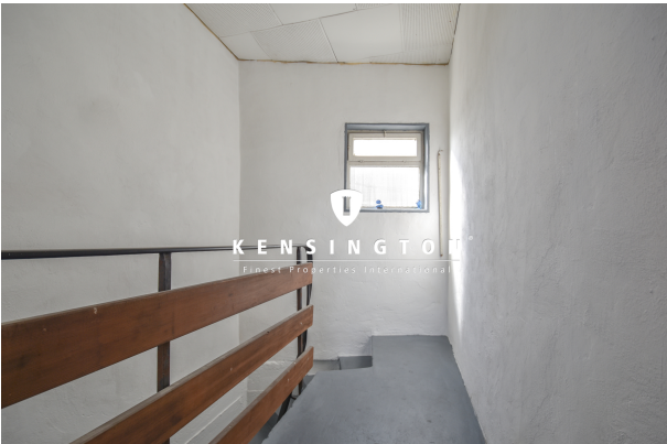
KSW313-Haus in Essingen-Treppenabgang