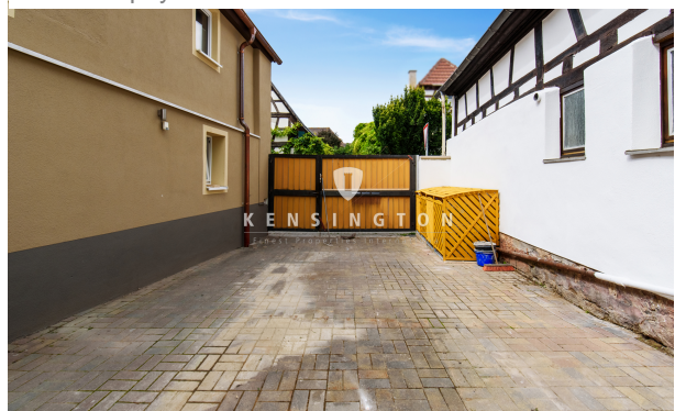
KSW_428-Wohnung in Lachen-Speyerdorf-Gemeinschaftshof