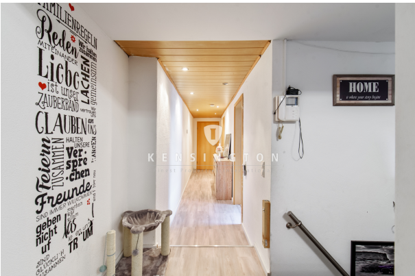
KSW_428-Wohnung in Lachen-Speyerdorf