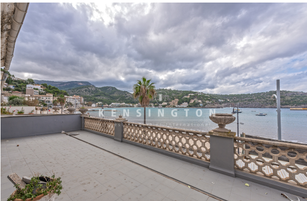
Soller-Wohnhaus-Terrasse erste Meereslinie