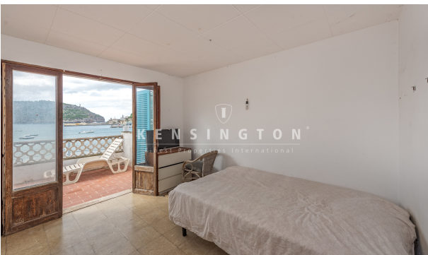
Soller-Wohnhaus-Schlafzimmer mit Terrasse u. Meerblick