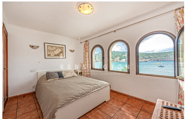
Soller-Wohnhaus-Schlafzimmer mit Meerblick