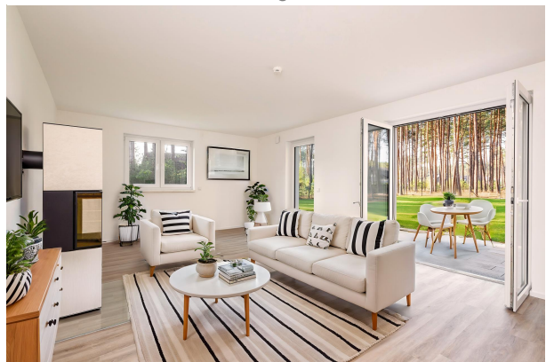
Wohn- und Essbereich - staged