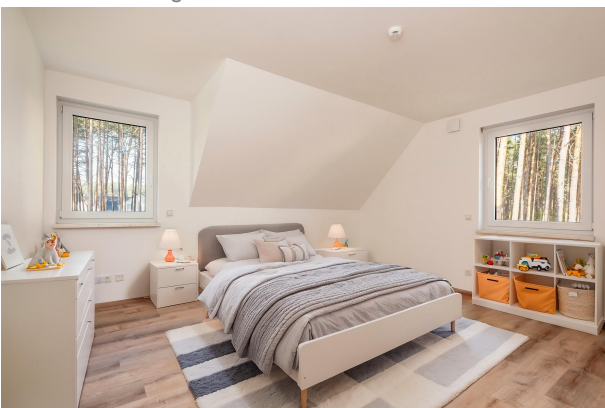
Zimmer III - staged