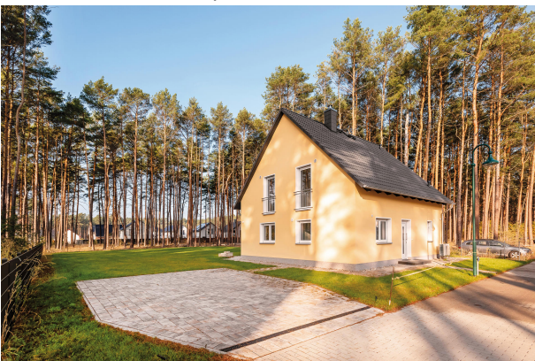
Frontansicht und Stellplätze