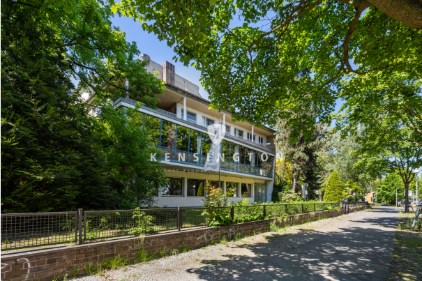
mögliches neues Gebäude mit Baugenehmigung