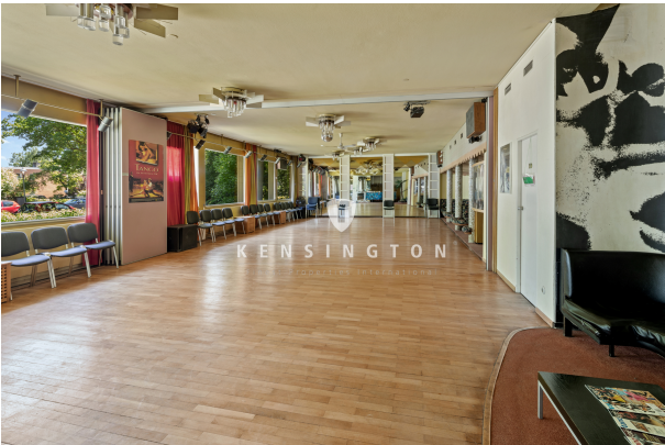
Raum 2 im Abrissgebäude