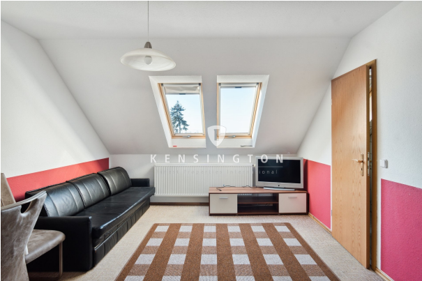
Wohnzimmer in einer der Wohnungen