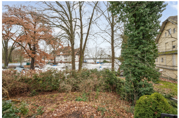
Blick auf den großen Wannensee aus dem Vorgarten