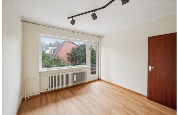
Zimmer im 1. OG