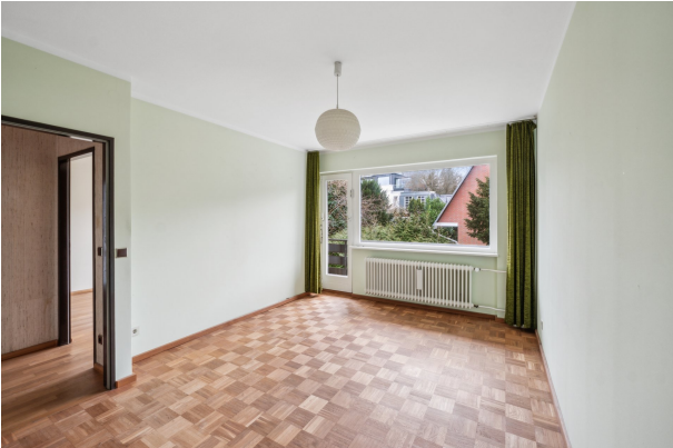
Schlafzimmer im 1. OG