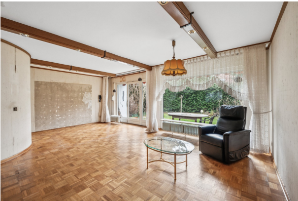
Wohnzimmer mit Zugang zur Terrasse