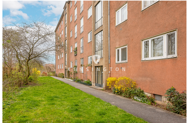
Park vor dem Haus