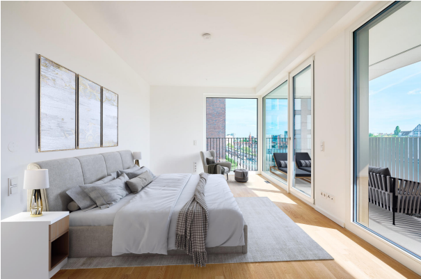
Hauptschlafzimmer mit Zugang zur zweiten Terrasse