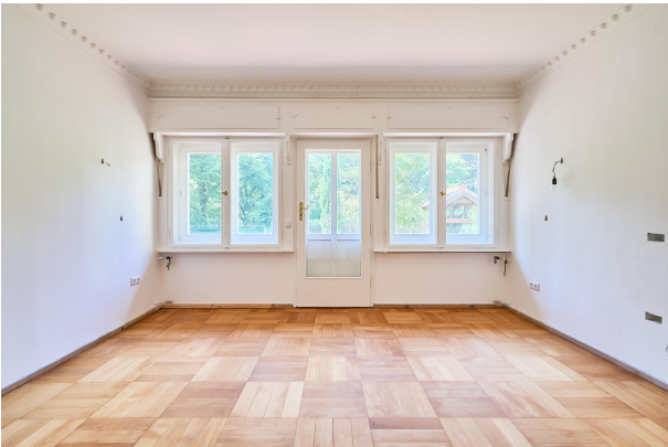
Visualisierung und Einrichtungsidee zum Esszimmer