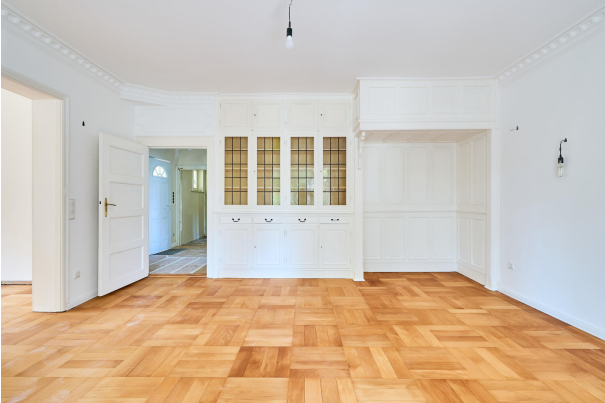
Visualisierung und Einrichtungsidee zum Wohnzimmer