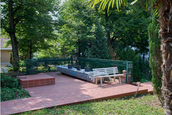
Traumhaft gelegenes Einfamilienhaus in Frohnau