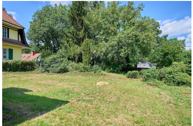
Hausansicht mit schönem Terrassen- und Gartenbereich