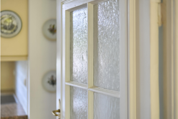
Gäste-WC im Erdgeschoss