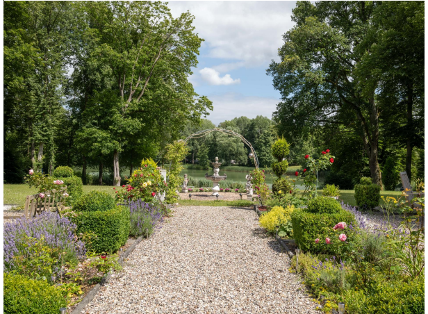
Blick in den schön angelegten Garten