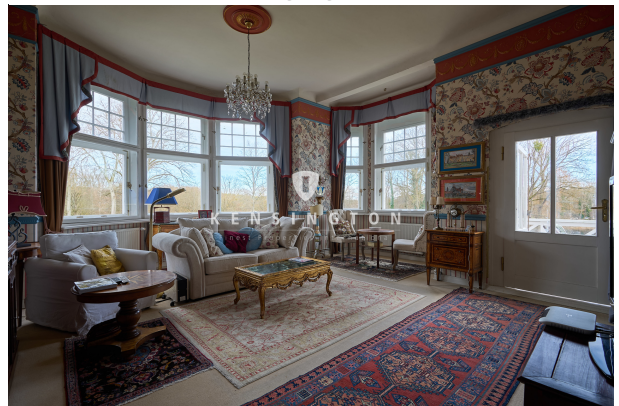
Wohnraum im OG mit Zugang zur Terrasse