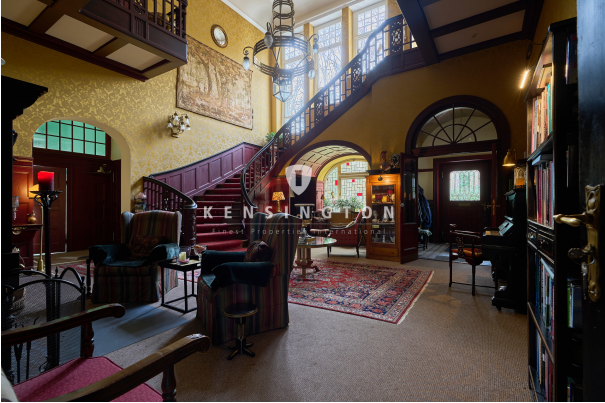
Eingangshalle mit ca. 7,5 m Deckenhöhe