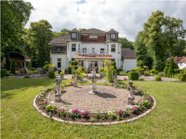
Gartenansicht des Anwesens