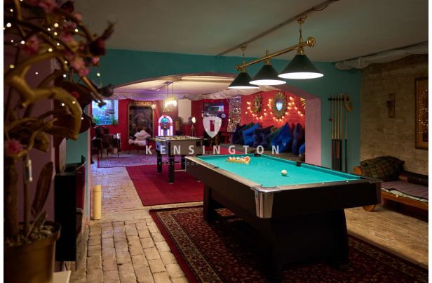
Hobbyparadies im Keller