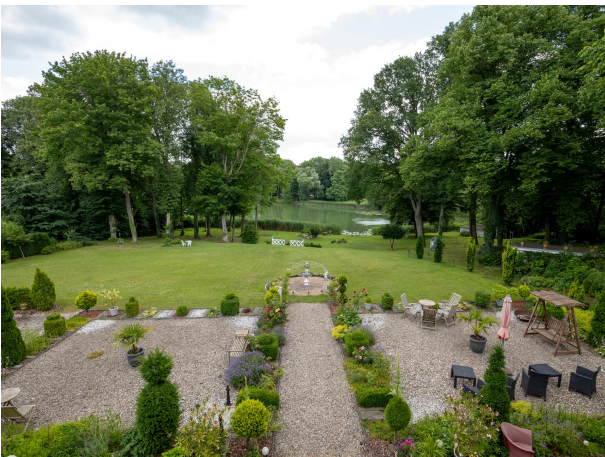
Blick von der Sonnenterrasse