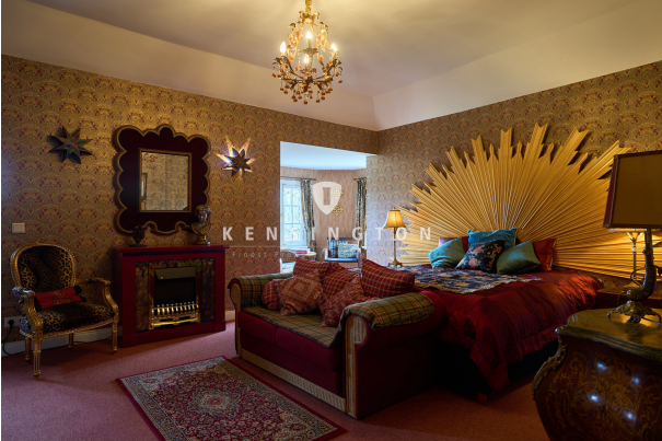
Schlafraum in der Belvedere-Etage im DG