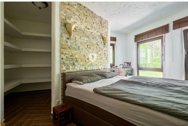
Schlafzimmer mit Ankleide