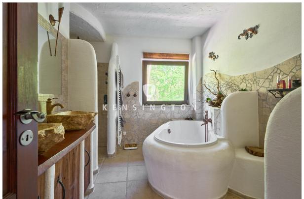
Badezimmer mit Dusche & Wanne