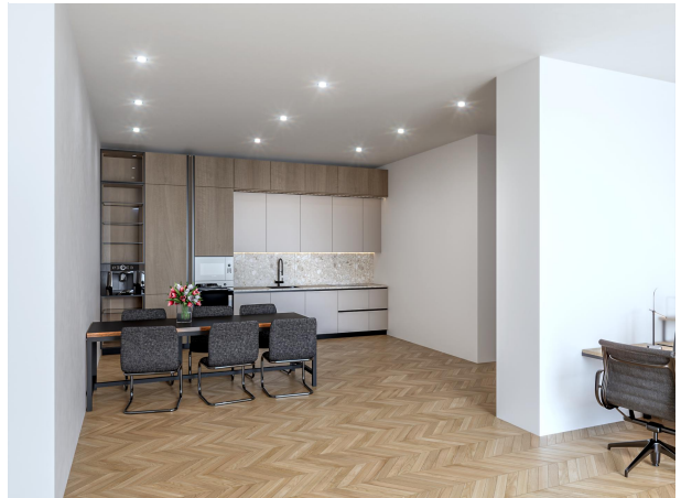
Möglicher Büroumbau, bereits genehmigt