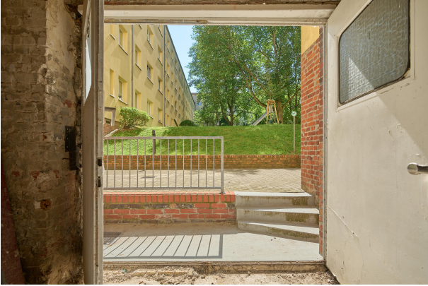
Unverbautes Souterrain gewährleistet viel Helligkeit