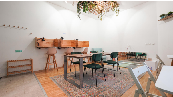
Vierter Raum, der aktuell autark genutzt wird