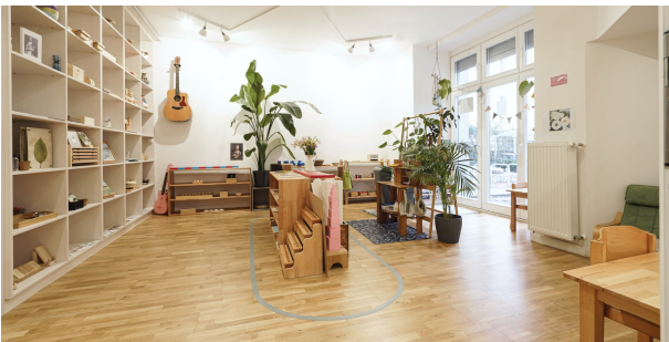
Geräumiger Wohn oder Arbeitsbereich - ganz nach Bedarf