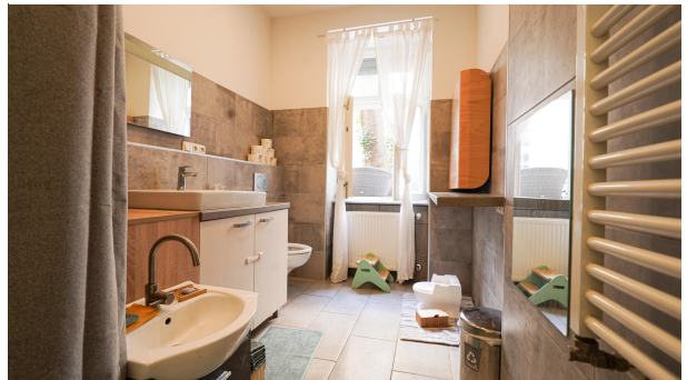
Modernes Duschbad im Eingangsbereich