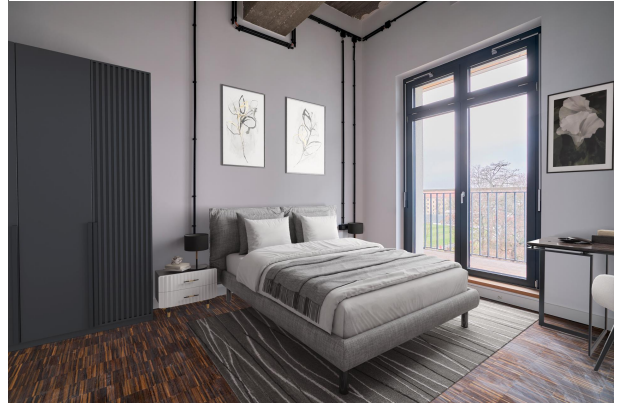
Schlafzimmer - Beispiel