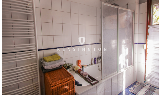
Badezimmer Ansicht 2_Maisonette Wohnung_KBR_165