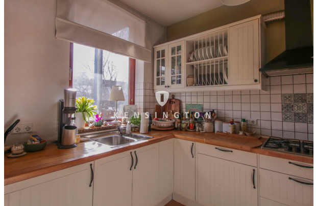
Küche Ansicht 3_Maisonette Wohnung_KBR_165