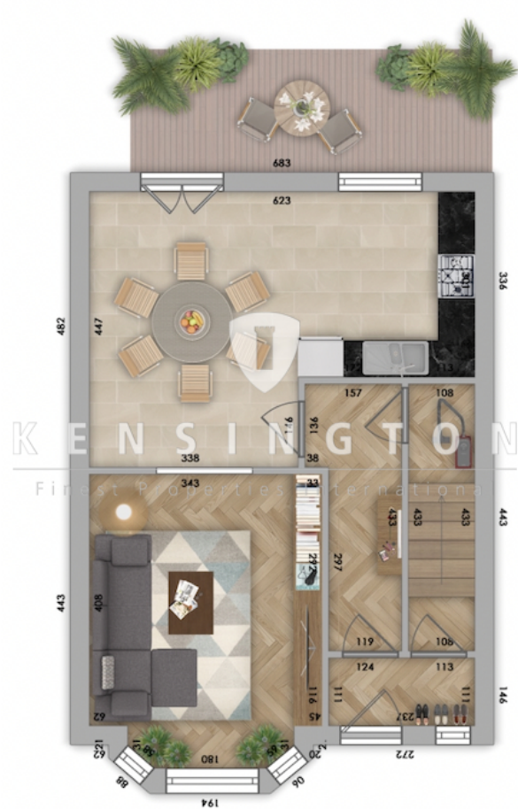
Grundriss Erdgeschoss_Maisonette Wohnung_KBR_165