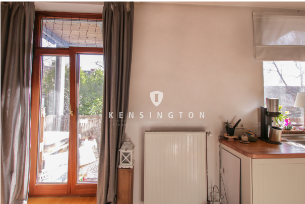
*Küche Ansicht 2_Maisonette Wohnung_KBR_165