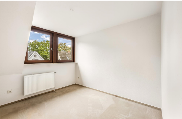
Schlafzimmer im Obergeschoss (Einrichtungsbeispiel)