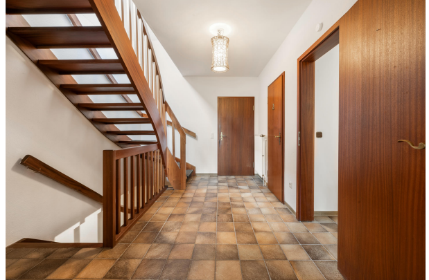
Zimmer im Obergeschoss