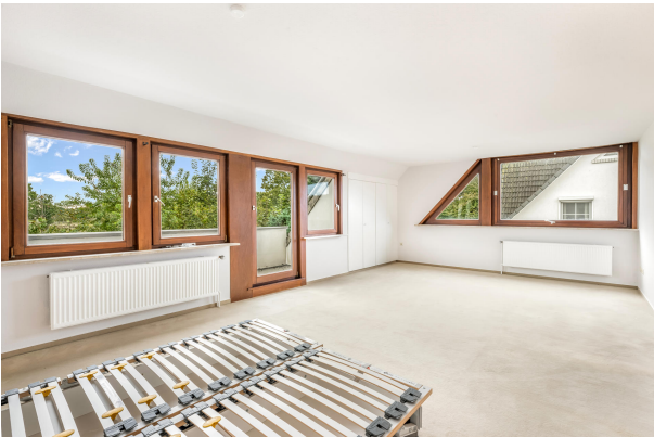
Schlafzimmer mit Zugang zum Balkon