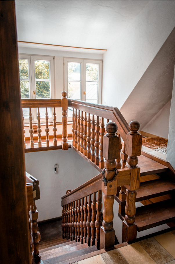
Aufgang zur 1. Etage