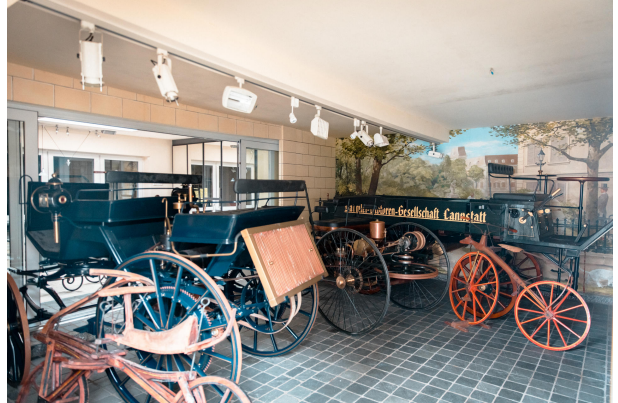
Stellfläche im Hobbyraum des Nebengebäudes