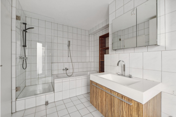
Ensuite Badezimmer Dusche und Badewanne