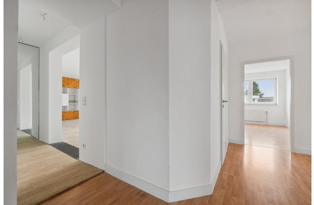
Diele Ansicht 3