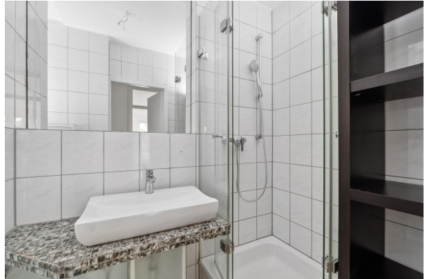
Duschbad inkl. Gäste WC