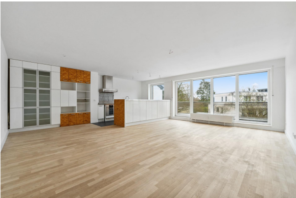
Wohnküche mit Terrasse