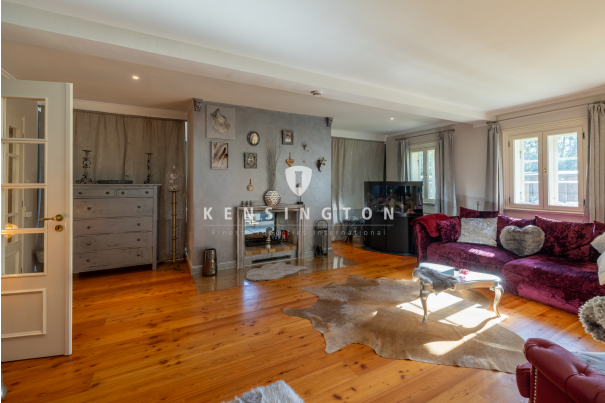
EG - Wohnzimmer