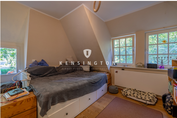
DG - Schlafzimmer 2