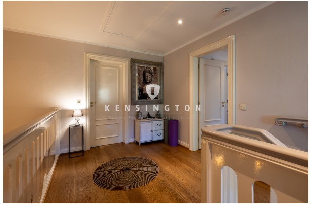
DG - Galerie