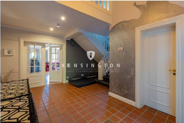
EG - Diele