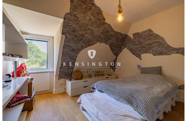
DG - Ankleidezimmer