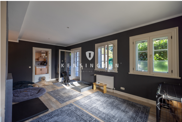
EG - Wohnzimmer