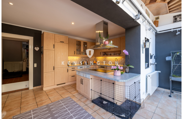
EG - Küche