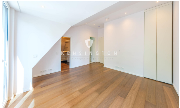
Hochwertige ankleide mit Böhmler-Einbauten im DG