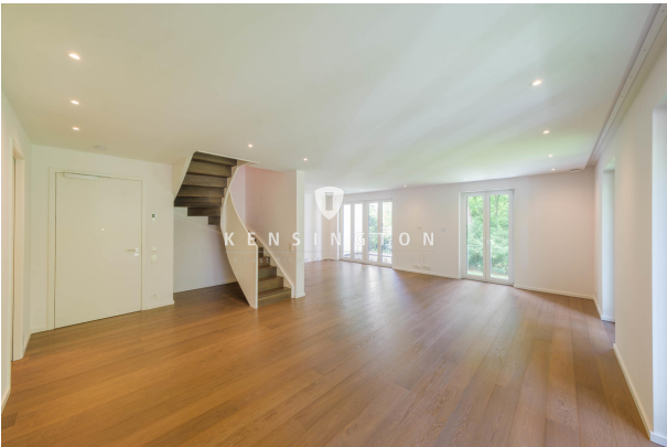
Viel Platz im hellen Wohnzimmer