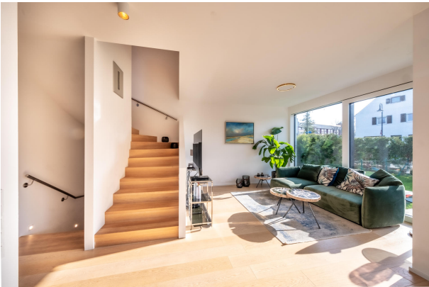
Offenes Treppenhaus in das 1. Obergeschoss