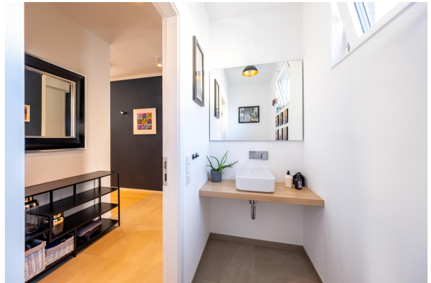
Helles Gäste WC mit Tageslicht