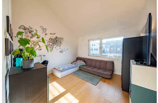
Weiteres großes Kinderzimmer