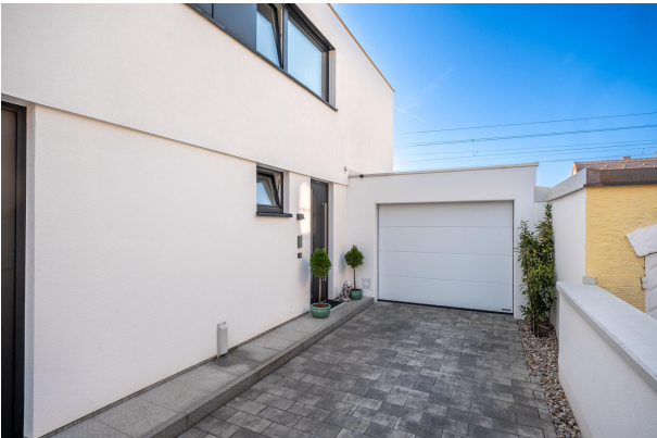
Einfahrt mit geräumiger Garage