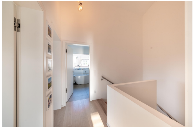
Großzügiger Flur im 1. Obergeschoss