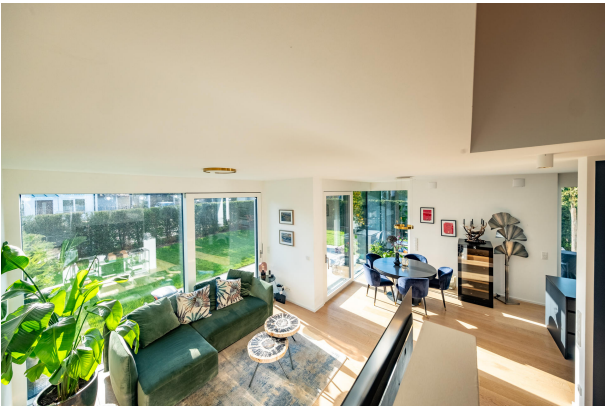
Sonniger Wohn- Essbereich