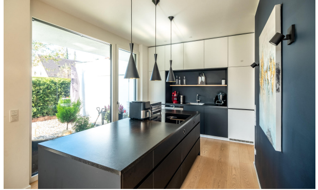
Hochwertige schwarze Schreinerküche mit Markeneinbaugeräten