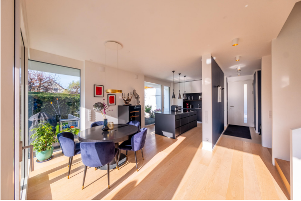
Essbereich mit einer großen Fensterfront