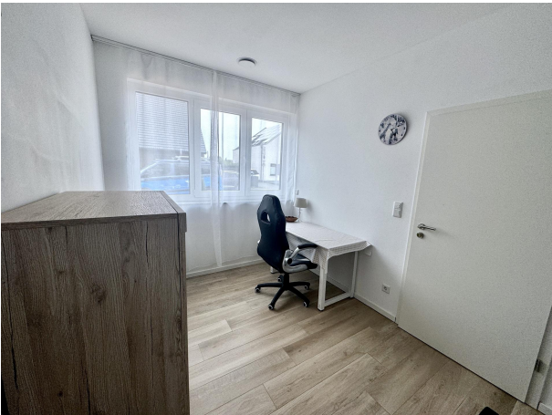
Schlafzimmer II Einlieger EG