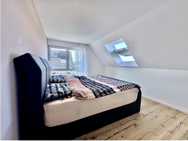
Schlafzimmer I OG