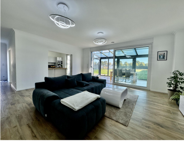
Hauptwohnung Wohnzimmer I