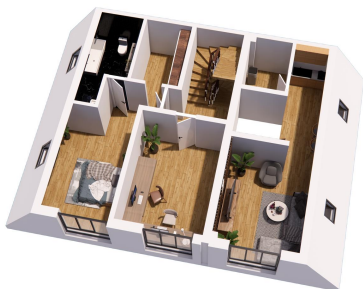
OG Perspective View