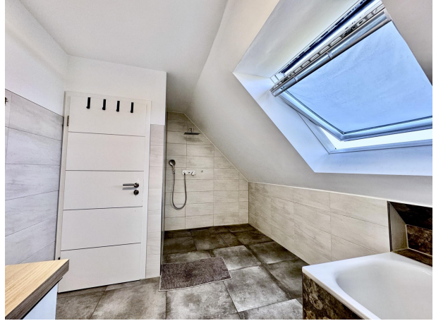
En Suite Bad mit Wanne & Dusche II