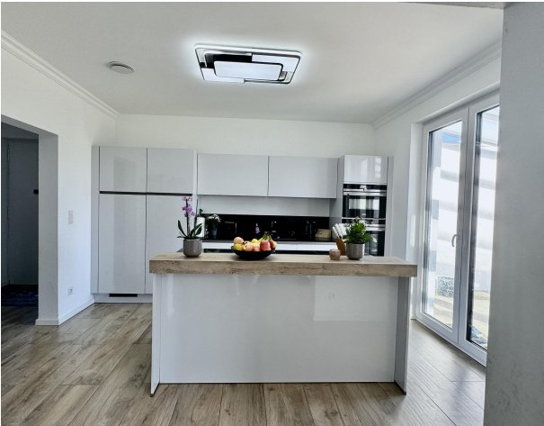
Hauptwohnung Einbauküche I