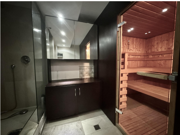
Sauna mit Dusche im UG