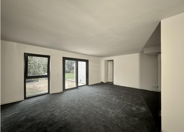
Garagenumbau Appartement mit Terrassenzugang