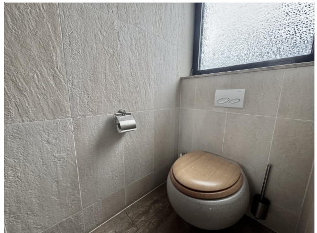
Gäste WC im EG II