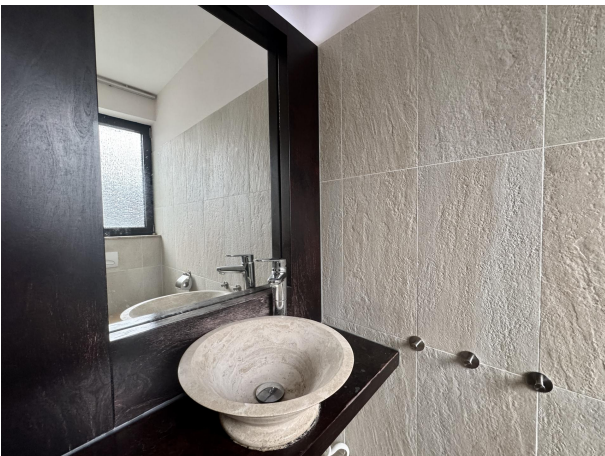
Gäste WC im EG