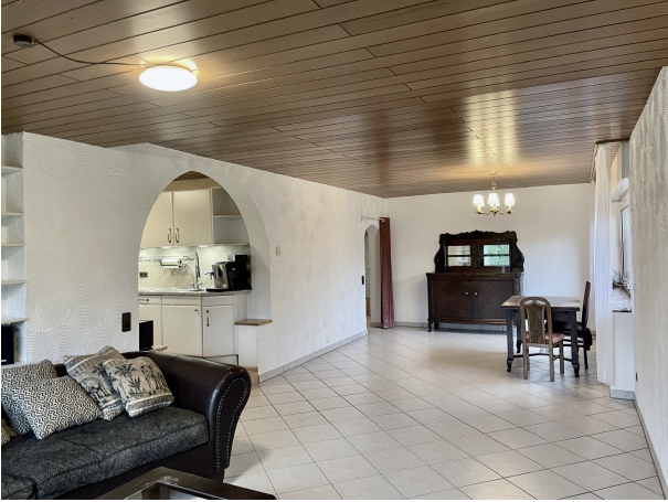
Wohnzimmer mit Blick von der Terrassentüre