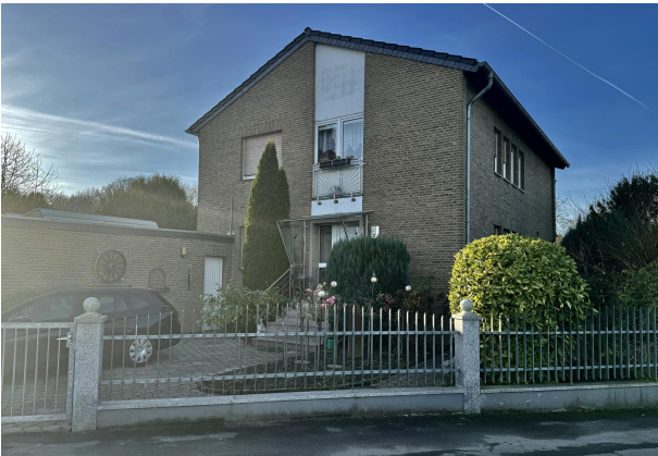
Perspektive Front von Strasse