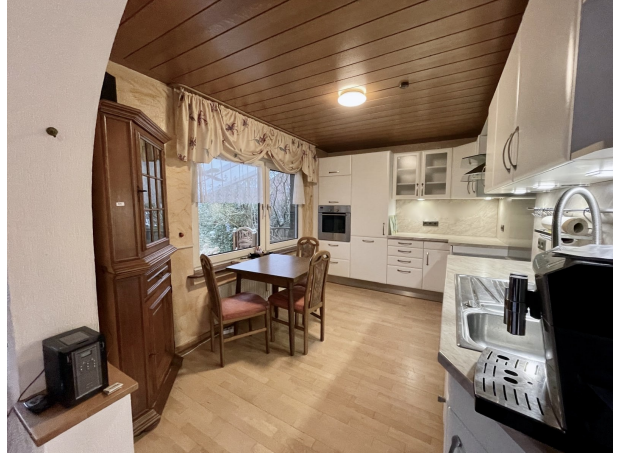
Küche I EG