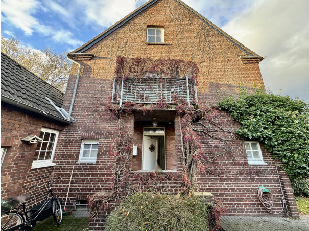
Hauseingangsbereich Giebel links