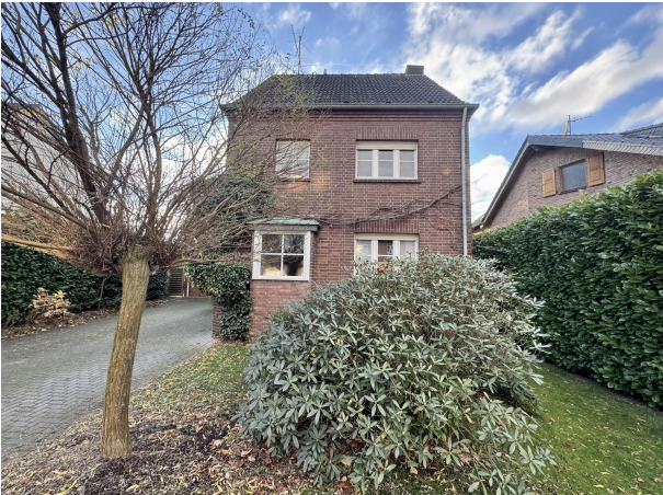
Frontansicht vom Bürgersteig