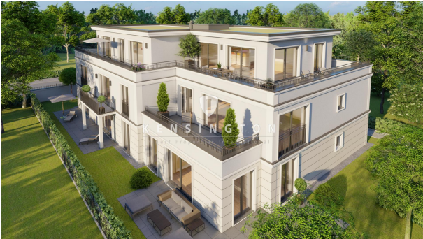
Außenansicht mit Blick auf das elegante Projekt