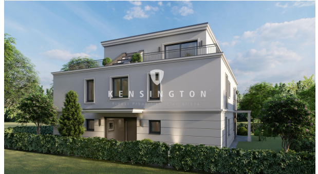
Außenansicht mit Blick auf den Eingangsbereich