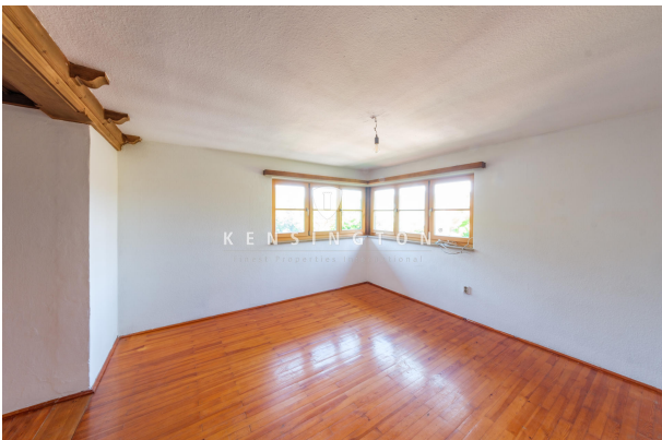
Wohnbereich mit Seeblick