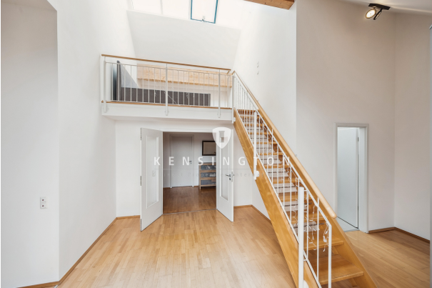
Wohnzimmer mit Blick zur Galerie