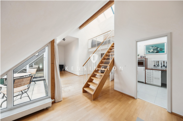
Wohnzimmer mit Zugang zur Küche