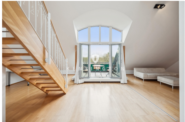
Wohnzimmer mit Süd-Balkon