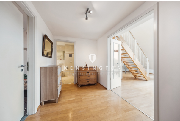
Eingangsbereich - Flur