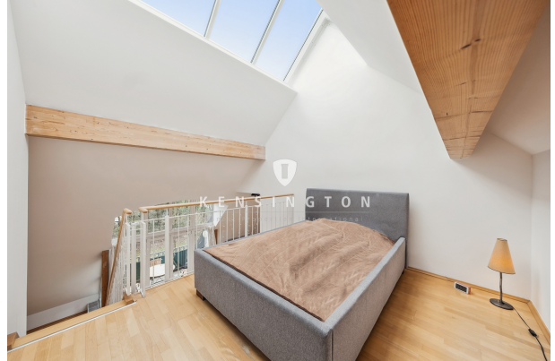
Galerie - Schlafbereich - Büro