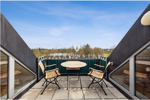
Balkon nach Süden