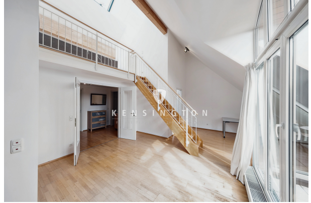
Wohnzimmer mit Essbereich